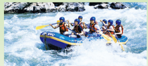
アースシップ(郡上) ●お問い合わせ/TEL.0575-79-4070 OD-FARM 荘川 ●お問い合わせ/TEL.05769-2-1011

ゴムボートに乗り、パドルを使って水しぶきを浴びながら川を下っていく人気のリバースポーツ。四季の郷からは「アースシップ」まで車で約50分。また周辺では「OD-FARM 荘川」が車で約10分とアクセス抜群です。