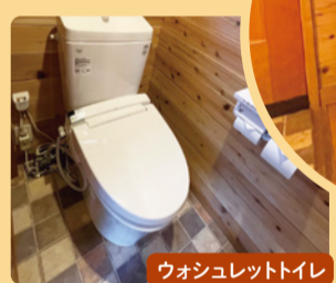
ウォシュレットトイレ