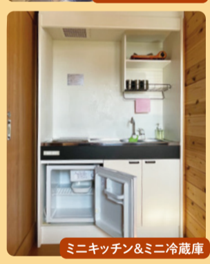
ミニキッチン&ミニ冷蔵庫