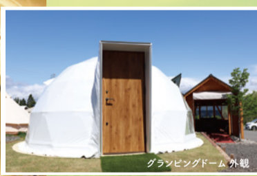
グランピングドーム 外観

生ビール、ワイン(赤・白)、焼酎(芋・麦)、レモンサワー、ハイボール、ソフトドリンク各種など豊富な種類のドリンクが「飲み放題」でご利用いただけます。またアルコールドリンクの他にもティーバッグ(緑茶・紅茶・アップルティー)の他、ウォーターサーバーも完備。大人だけでなくお子様もお楽しみいただけます。