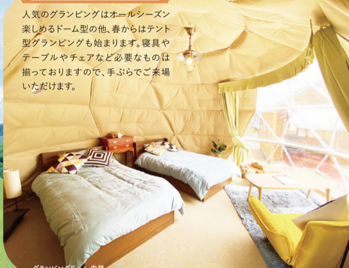
グランピングドーム 内装

人気のグランピングはオールシーズン楽しめるドーム型他、春からはテント型グランピングも始まります。寝具やテーブルやチェアなど必要なものは揃っておりますので、手ぶらでご来場いただけます。